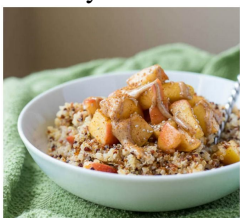
Peach Quinoa BREAKFAST BOWL

Download Full Pages Read Online Insanely Delicious Easy Breakfast Recipes Mouthwatering Recipes Insanely Delicious Easy Breakfast Recipes Mouthwatering Recipes Ready In Minutes Or Less for